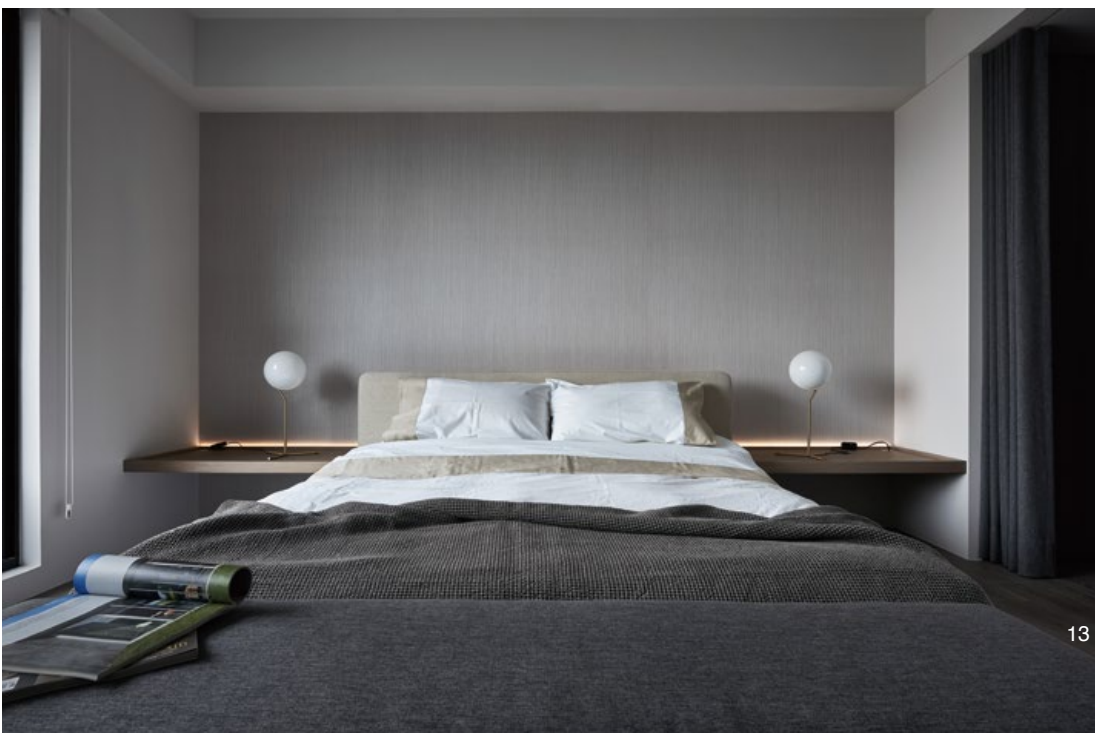
12. 餐廳的牆面掛上一顆燈泡，營造「一輪明月高高掛」的意境。燈泡與餐廳吊燈相互呼應，在畫面的建構上做一個平衡。13. 臥室以暖色系的色調呈現。 14. 主臥房一隅。燈飾兼具擺飾功能。15. 廊道以鑿多魔為主要建材，在視覺上具有水波紋的效果，十分優雅。 12. A single light bulb on the surface of the dining room partition faces an elaborating crafted lamp in the living room 13. Warm color was used in the bedroom 14. Master bedroom furnishing ambience 15. Pandomo floor has a reflective surface like water