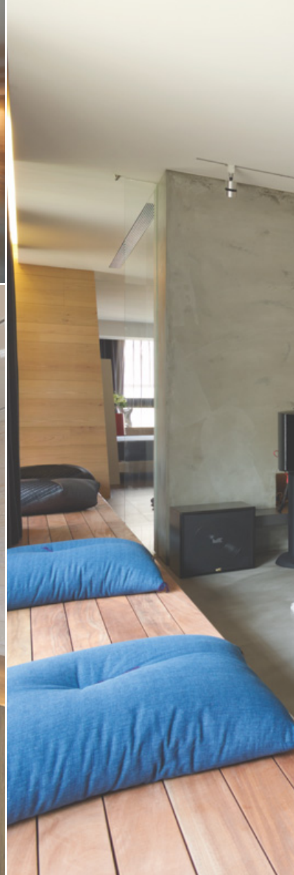
4. 島檯、桌椅以及窗邊長椅讓使用者可以自由隨興的圍聚閒聊，自然而然的形成許多相聚角落。5. 廳區立面的清水泥粉光經由細磨收尾，施以適當的手作痕跡，在光線撫照中形成詩意的層次微變。6. 在前段公共廳區與後段臥房之間，設置一座長廊作為公私領域的緩衝，加密後段臥房空間的隱私性。7. 公共空間沒有明確的場域分割，當家中舉辦聚會時，交誼空間可以涵蓋至客廳、餐廳、吧檯、廚房，足夠容納30多人同時活動。

在公領域部份，本案並無刻意切分玄關、廳區、廚區，而是利用中島設置來示意範疇，中島量體亦複合了鞋櫃、廚具等功能，能滿足日常實質的使用需求。由於沒有明確的場域分野，因此當家中舉辦聚會時，交誼空間可以涵蓋至客廳、餐廳、吧檯、廚房，足夠容納30多人同時活動，餐桌也能夠分割搬動，因應當下的桌檯配置需求。此外，島檯、桌椅以及窗邊長椅均能自成小區，讓賓客自由隨興的圍聚閒聊，自然而然創造許多相聚角落。本案不刻意分割空間，令彼此界線模糊，藉由座椅、檯面的靈活性，使其衍生許多圍聚點的配置手法，主要目的是希望藉由場域的自由度，促進宴會時的賓客交流，催化活動氣氛。另一方面，空間也企圖以最簡潔的線條、材質，碰撞出最舒適的氛圍，主要以木料、清水模、鐵件等材料營造既樸素又優雅的色調。玄關區使用灰色石英磚與廳區的磐多魔地坪區隔。廳區主牆與廊道立面採用清水泥粉光，看似質地均勻的表面，其實經由細磨收尾，施以適當的手作痕跡，在光線撫照中形成一種詩意的層次微變。