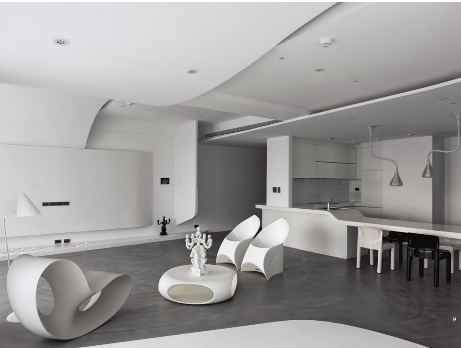
7. 安置在灰色地坪上的白色家具，宛如浮於河面的飛石，將步伐引至彼岸。8. 運用岸地、河流、飛石等元素摹寫自然，將人造的山水情境展現於眼前。9. 室內呈現開放型態，僅利用地坪層次或是家具高度為場域劃界。10. 採用隱藏式收納，維繫整體視覺上的簡潔開闊。 7. White furniture pieces look as if they are rocks protruding from a river 8. "River landscape" in the space 9. Open style living space 10. Hidden storage space is used to prevent unwanted visual disturbance