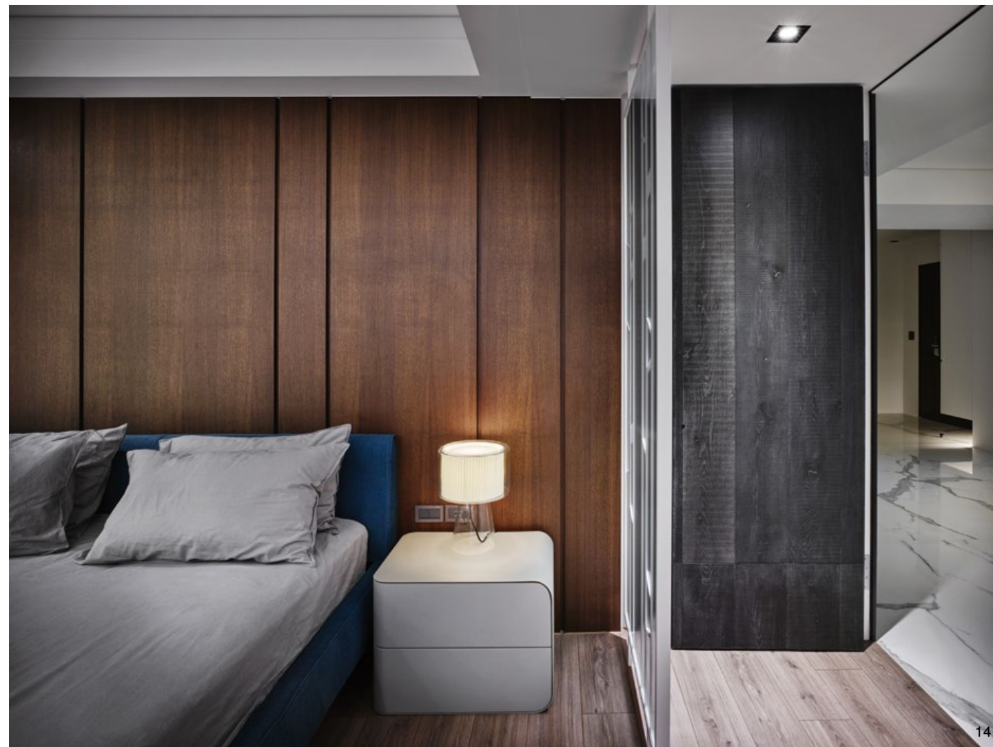
11. 書房用色沉穩，提供男女屋主靜心辦公的場域。（李國民攝影）12. 書房臥榻利用窗邊角落塑成，像是一座半開放式的盒體。（李國民攝影）13. 主臥更衣室。（李國民攝影）14. 主臥房，色調溫暖，選材注重觸感與細節的舒適感。（李國民攝影） 11. Reading room and working space. (Figure x Lee Kuo-Min Studio) 12. Reading room and a couch against the window. (Figure x Lee Kuo-Min Studio) 13. Dressing room, inside the master bedroom. (Figure x Lee Kuo-Min Studio) 14. Master bedroom view. (Figure x Lee Kuo-Min Studio)

Ray's insistence on white sometimes encounters challenges and he did seek new interpretation under this apparent obsession; he experimented on using various materials to interact with the white color material; wood pieces and marble, which reveal natural textures, meet with the pure white surface to make a strong contrast and differences in weathering marks.