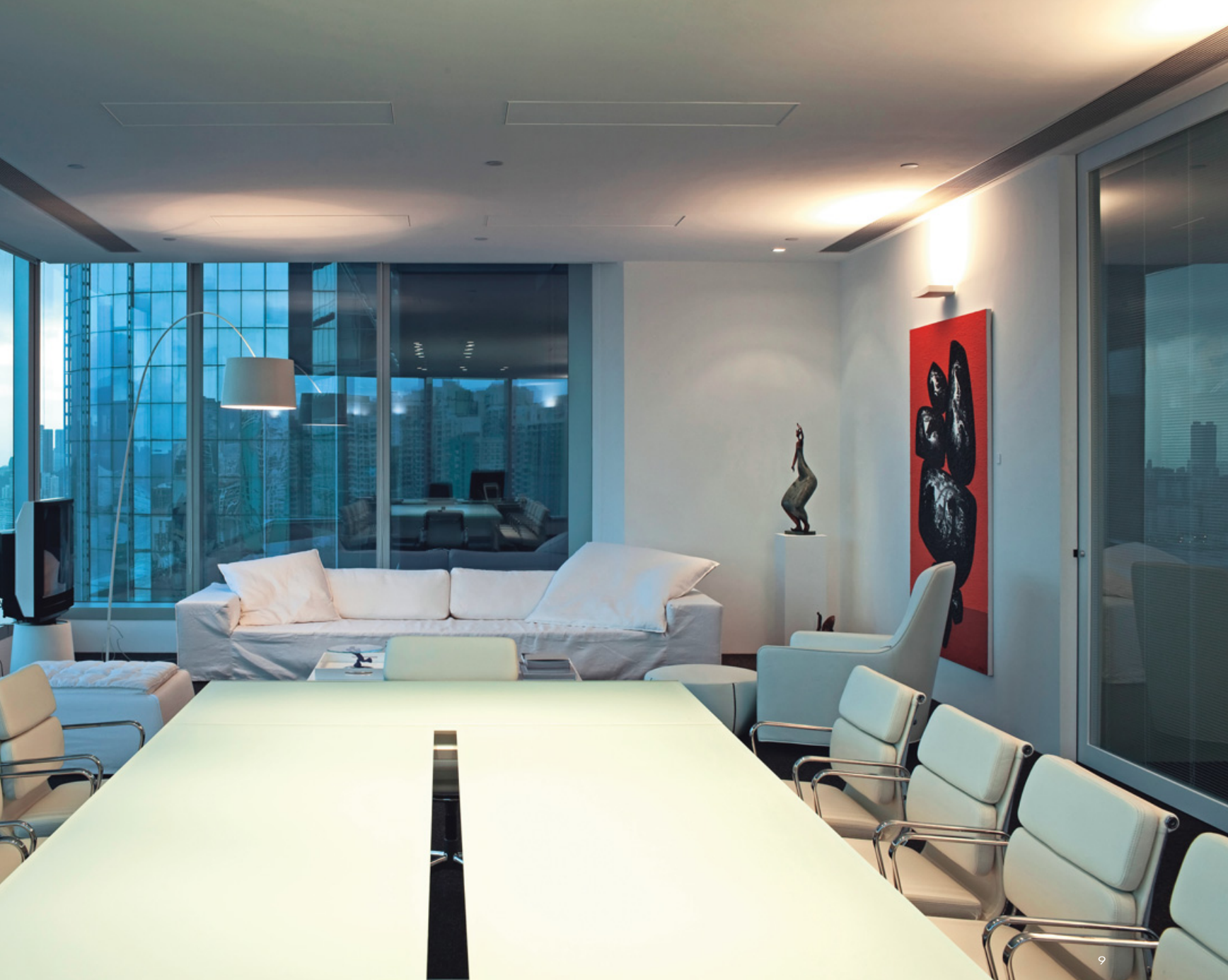
6. 落地鏡寫下「Enjoy Life Enjoy Design」字樣引領訪客進入白色長廊。7. 會議室內掛著王廣義的版畫作品「信仰的面孔I - IV」。8. 通往梁志天設計師辦公室的長廊展示了當代中國藝術家張曉剛和王廣義的版畫作品。9. 梁志天設計師辦公室特意用潔白的空間和家具烘托藝術品與窗外景致。10. 平面圖。11. 梁志天設計師辦公室，豐富的當代畫作與雕塑，展現這座辦公空間滋養性靈的感性面。12. 梁志天設計師辦公室，擁有270度看望維多利亞港美景的視野。13. 梁志天設計師辦公室細部。