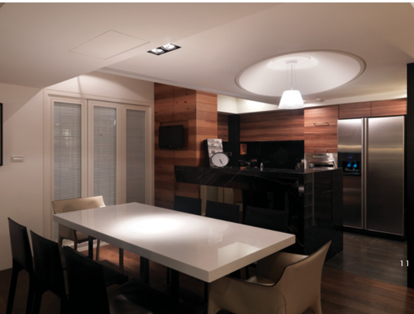
10. 餐廳與客廳的空間關係。11. 餐廳與開放式廚房。12. 閱讀區與餐廳之間，兩端各有一道清玻璃活動拉門。13. 樓梯旁的走道讓整體配置多了一個轉換的樞紐。