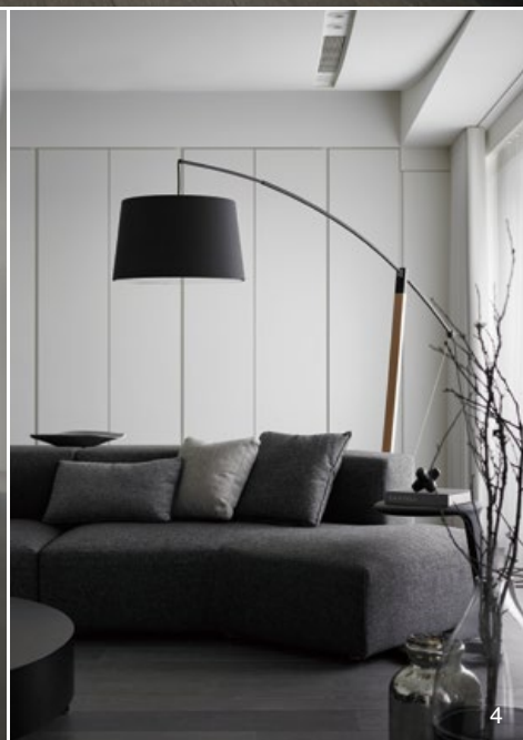
2. 收納櫃體運用與牆面同一色系的門片，整齊一致地隱沒於立面之後。3. 牆面櫃位於轉角採用適度的鑿切鏤空，賦予牆體輕盈漂浮感。4. 在改變客廳電視牆方位後，家具配置更為自然而有序。5. 設計師拓寬打通原始畸零格局，將客廳、廚房、辦公空間置於開放式軸線上。