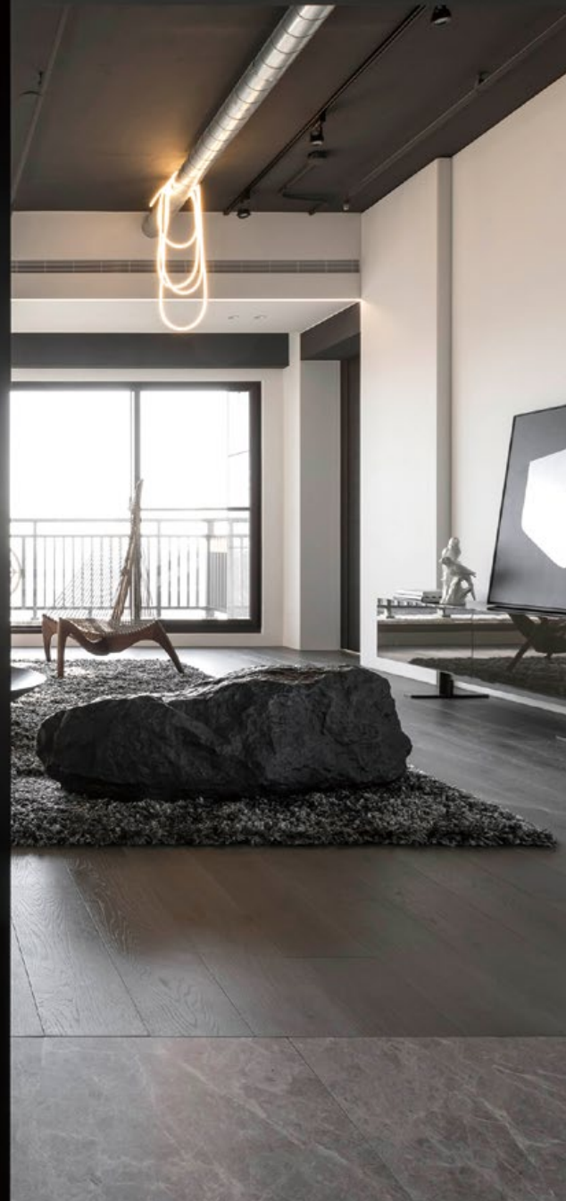
3. 以金屬網材質弱化牆體存在感，並豐富空間層次。4. 鐵件上增加板面，使其兼顧裝飾與機能性。5. 空間以光影作為主角，藉由軟裝的搭配增加變化。6. 中央主樑以灰鏡減低其存在感，產生虛實變幻。7. 平面圖。8. 纏繞於管線上的 LED 燈條象徵蟒蛇。