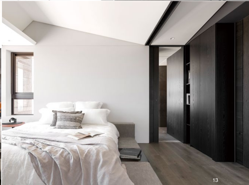
9. 整體空間佈局以平衡延伸為重點。10. 特殊傾斜天花使臥房視覺更加強烈。11. 斜天花的設計弱化原始建築中樑位與空調管線的存在感。12. 大面積的深色櫃體使臥房更為沉穩。13. 仿傾斜屋頂的角度使臥房更具有居住感受。