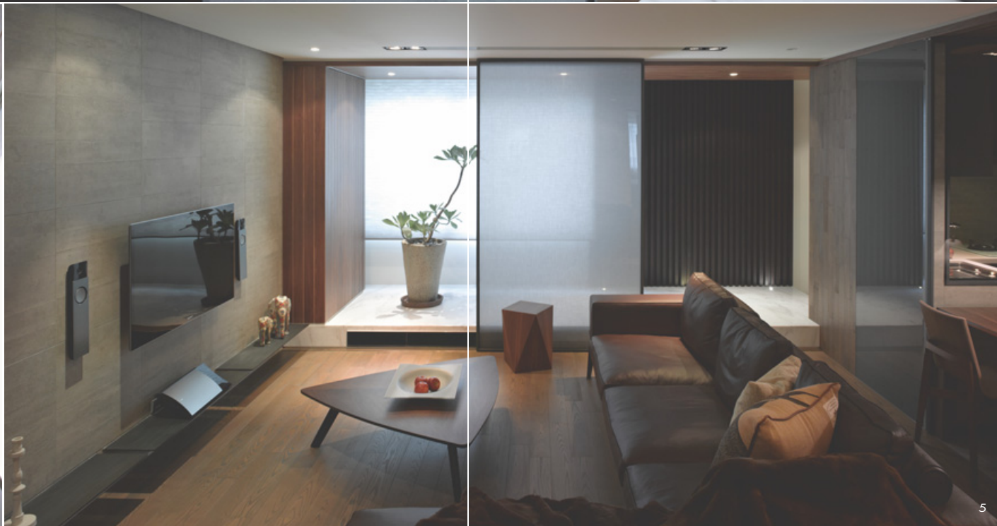
3. 玄關平台位於客廳與戶外陽台之間，沈志忠在此利用一道質地穿透的活動式幕簾，當落地窗景觀敞開時，光線能密緻向內空間蔓延，同時也能維持客廳活動的隱私。4. 玄關端景的植栽，為小環境填入自然的風味。5. 從客廳向落地窗放望，在濾光性極佳的屏遮中，日光朦朧浸潤了玄關平台，與空間的層次徐緩遞進。6. 平面圖。