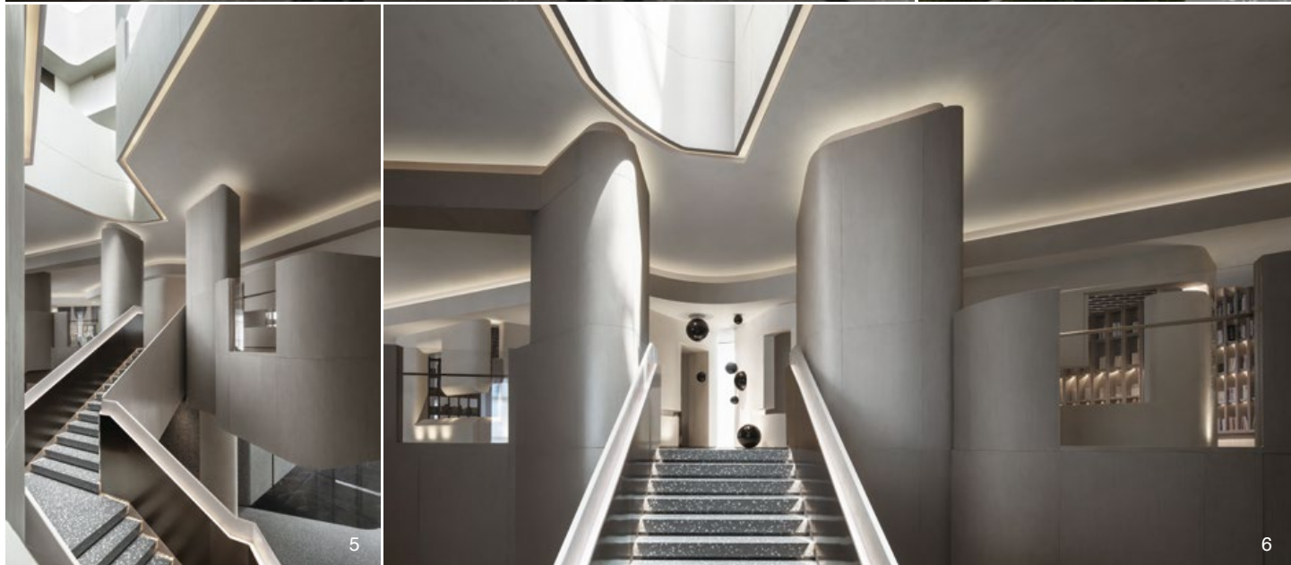
3. 入口處接待櫃台，強調量體與線條視覺。4. 自下方觀看 2 樓連接處階梯。5. 1 至 3 樓中央設置天井，使光線與視覺垂直貫穿。6. 2 樓入口處，燈光運用間接線性燈帶點綴層次。7. 樓梯給予空間豐富線條比例，強調視覺張力。