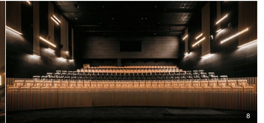
3. 豎向格柵自天花延伸至地面，打造壯闊視覺。4. 隔斷延續書架造型，分隔人流並保持視覺通透。5. 空間運用金色與灰色呈現一致性。6. 將販賣區與書店置於空間兩端，避免相互打擾。7. 訂製燈具仿擬琴弦造型，自天花板垂掛而下。8. 巨幕影廳內燈具、護欄及地毯圖樣皆延續「琴弦」概念。9. 平面圖。