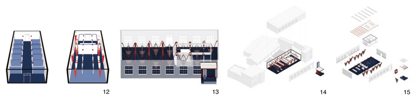
7. 公益店舖以製豆腐房為起點，再依序朝內引導出櫃檯、展售區以及用餐區。8. V 點結構作為空間最富張力的語彙，卻是以和諧共存的方式介入舊空間。 9. 建築方窗層疊上 V 型結構，讓內觀外視野又多了一份框景線條和層次。10. 原始的柱列洋溢結構美，設計導入黑色 V 架構來映襯，形成歷時古今的對話關係。11. 設計依據原有病房區的格局，將中央巡房的廊道重塑為展售與用餐的空間，佇立其中依舊能感受到水平長軸的尺度。12-15. 位於室內的 V dots 構造概念圖。 7. Kitchen is in the central space of the shop. 8. V dots structure. 9. V dots structure frames a view that mingles old and new. 10. Exiting columns with good detailing dialogues with the V dots metalwork. 11. The layout follows the existing plan of the old clinic without a total transformation. 12-15. V dots element in evolving process.

除了與柱列映襯媲美的 V dots，蔡嘉豪亦擷取黑色鐵件此一語彙和建築大樑對話，設計以懸吊方式將薄板金屬輕盈地置於樑下，舉凡軌道燈、投射燈等環境照明皆整合於其中，而如此刻意和樑脫開距離，目的在於彰顯原始柱頭的工緻造型，蔡嘉豪談到：「架構在金屬板上的燈具，除了供應室內照明，另以投射燈朝上打到柱頭位置，讓人們能察看美好的舊元素。」這種詮釋一如 V 點框架與建築窗櫺層疊出的景韻，讓場域在新舊共存中洋溢著有如生命體的脈動。就像「愛鄰醫院」四字招牌卸去後，牆垣上字體漫漶痕跡留成歷史一道鐫銘，讓建築積塵斑駁那份頹美與今共存。採訪 劉芝君