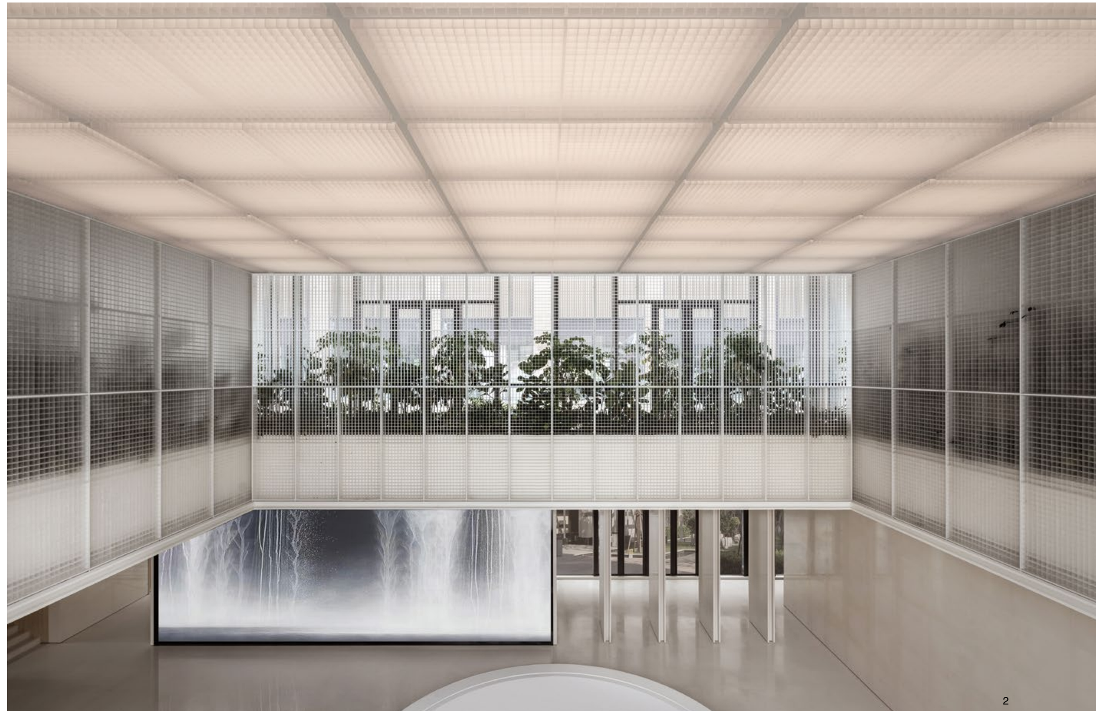
1. 大量使用霧面壓克力製成格柵系統，好似透過格狀的像素質回望畫面，創造與眾不同的效果。2. 本作位在中國天津，以「自然」跟「科技」的結合為關鍵字。

作為全中國最早接觸到「電影」這個新名詞的城市，天津受到過去外國租界歷史的影響，充滿異國風情與底蘊，而天津自古便建有大量各式各樣的橋樑，「一橋一景」的景致更是著名的旅遊特色。《綠洲演算法》的構築便是立基於這段故事背景中，基地坐落於植栽再造都市景觀的樞紐地帶，鄰近街廓將隨生活動線配置綠帶，水相設計團隊欲以天津電影為軸，利用影像語言將自然帶入現代居所，體現綠意和科技結合的未來世界觀。