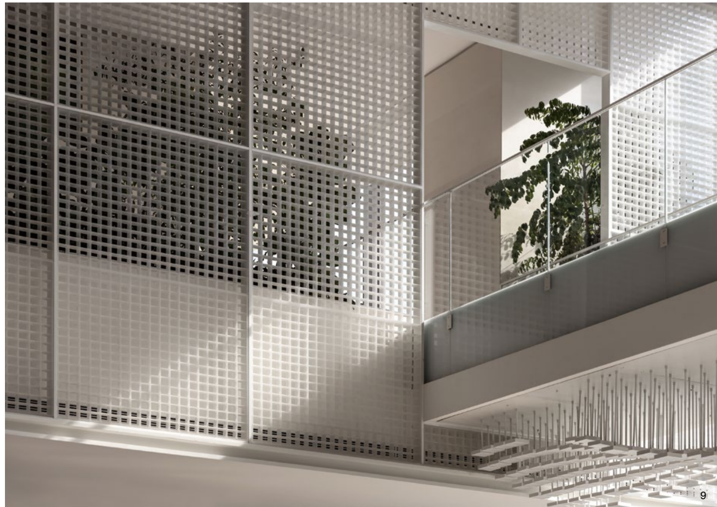
9. 細節。格狀後方的植物剪影突顯了觀看的層次。10. 2樓平面圖。11. 壓克力系統好似平面製圖中的 pixel，體現綠意和科技結合的面貌。12. 網狀結構雖然具穿透性，但同時又捎來一股霧化的視覺效果。13. 2樓的橋樑呼應了天津城市中「一橋一景」的特殊景觀。

團隊企圖使人踏入建築即陷入一場多格放映的劇場，而自然與科技的連結更是本作著重的一大焦點。四周的網狀系統皆由霧面壓克力製成，李智翔說明，他不希望植栽未經整理直接映入觀者眼中，因此透過網狀結構的設置，形塑造景隱約的輪廓，同時適切拿捏各式語彙之間的平衡。