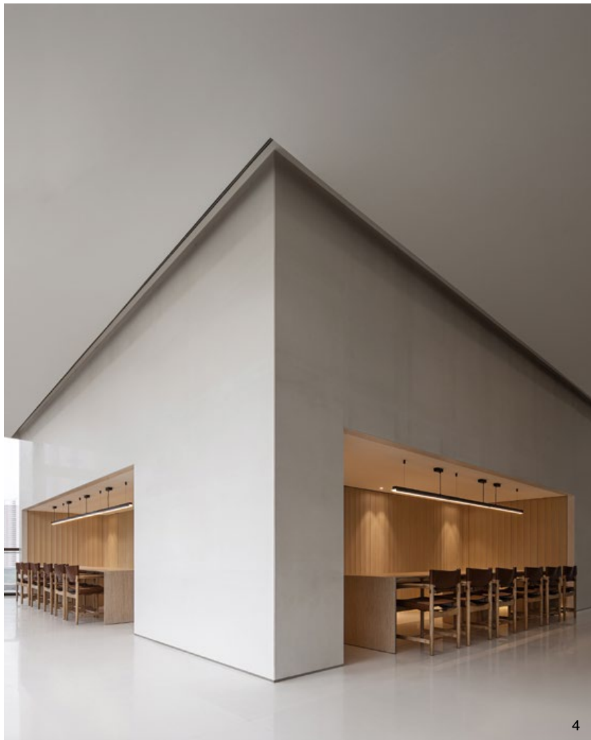
3.1樓平面圖。4.5.2樓的洽談空間。6.吧檯區。綠色石材和局部紅色調的運用，替空間疊加出細膩的層次。7.網格語彙貫徹整個售樓處，形塑一致的調性。8.設計團隊在部分立面飾以木質語彙，引入溫潤的感受。