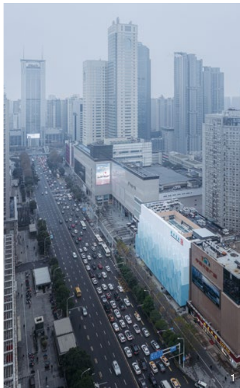
1. 俯瞰書店外觀。2.5 樓藝術書房。

設計團隊研思全案，在建築整理上拆除有安全疑慮的加建，施作結構加固，並且增加電梯與補強消防設施，為老書店新生打下基礎。研究過程裡，也邀請當地民眾回憶書店，然而經多次改造增建，迄今已無人可具體道出它最初模樣，但仍然會聽到這座書店是燈塔、是城市之光、是瞭解世界的視窗、是讓人明瞭山外有山等比喻，因而決定用鮮明易懂的象徵語彙重塑這間書店，為在地民眾建立這座文化場所的記憶。