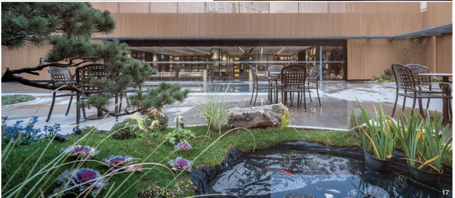
14. 光錐至屋頂層貫穿至 1 樓。15.2 樓全日書房。16.4 樓階梯講壇。17.7 樓屋頂花園。18. 光錐剖面圖。19. 外立面設計圖。

亦是每座層樓綠化的核心領域，各樓層綠化區的貫穿，形成一條綠色暗線與明亮光錐相對比，深刻大眾對於空間場所的印象與聯想：綠色所意喻的「生機」與光錐所代表的「希望」共同生生不息。