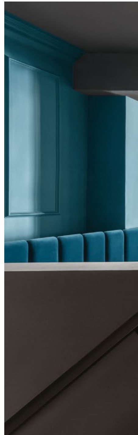
1. 1 樓平面圖。2. 空間明暢無阻，兩側桌區線性排列，背景相映成趣。

牆順勢引人從容地穿梭幽徑，在步步之間醞釀期待情緒。另一方面，再用建築的玻璃外牆加深好奇，在玻璃紋理與霧透交錯下，增添了透光卻不透視的曖昧，暗暗為室內補強採光，並對外重塑著街景構圖。