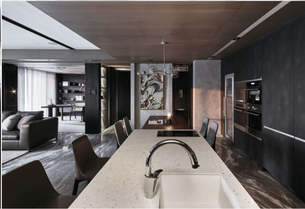
3. 客廳天花板使用噴白木作，吧台和書房上方的天花板則用木皮材料，利用建材以及高低變化賦予空間多變層次。4.5. 開放式廚房以木製矮餐桌結合高吧台，後方深色收納櫃以灰色類水泥質感的壁面襯托。6. 入口玄關透過穿透性玻璃與鏡子，延展空間視覺感。7. 書房空間利用活動拉門，可以依照需求開闢，形成獨立的私人空間。

為有更寬廣的公共空間，設計師在原配置上作客變，將三間臥室的格局改為兩間，規劃一間主臥室及一間客房。主臥室使用深色木皮，牆面搭配裱布鑲嵌金屬線條，電視牆延續客廳的設計手法，以白色石材做分割，呈現俐落而內斂的氣質；床頭後方規劃大型的更衣室，衣櫃選用鍍鈦金屬框與透明玻璃，除了具防塵功能，同時也能對衣物的收納配置一目瞭然；搭配四件式衛浴組，讓臥室更具完整性能。另一間客房，以大量木皮作主要用材，透過木皮格柵的分割設計，讓壁面在規律中增添細節，客房的設計較具機動性，未來可以規劃為小孩房使用。