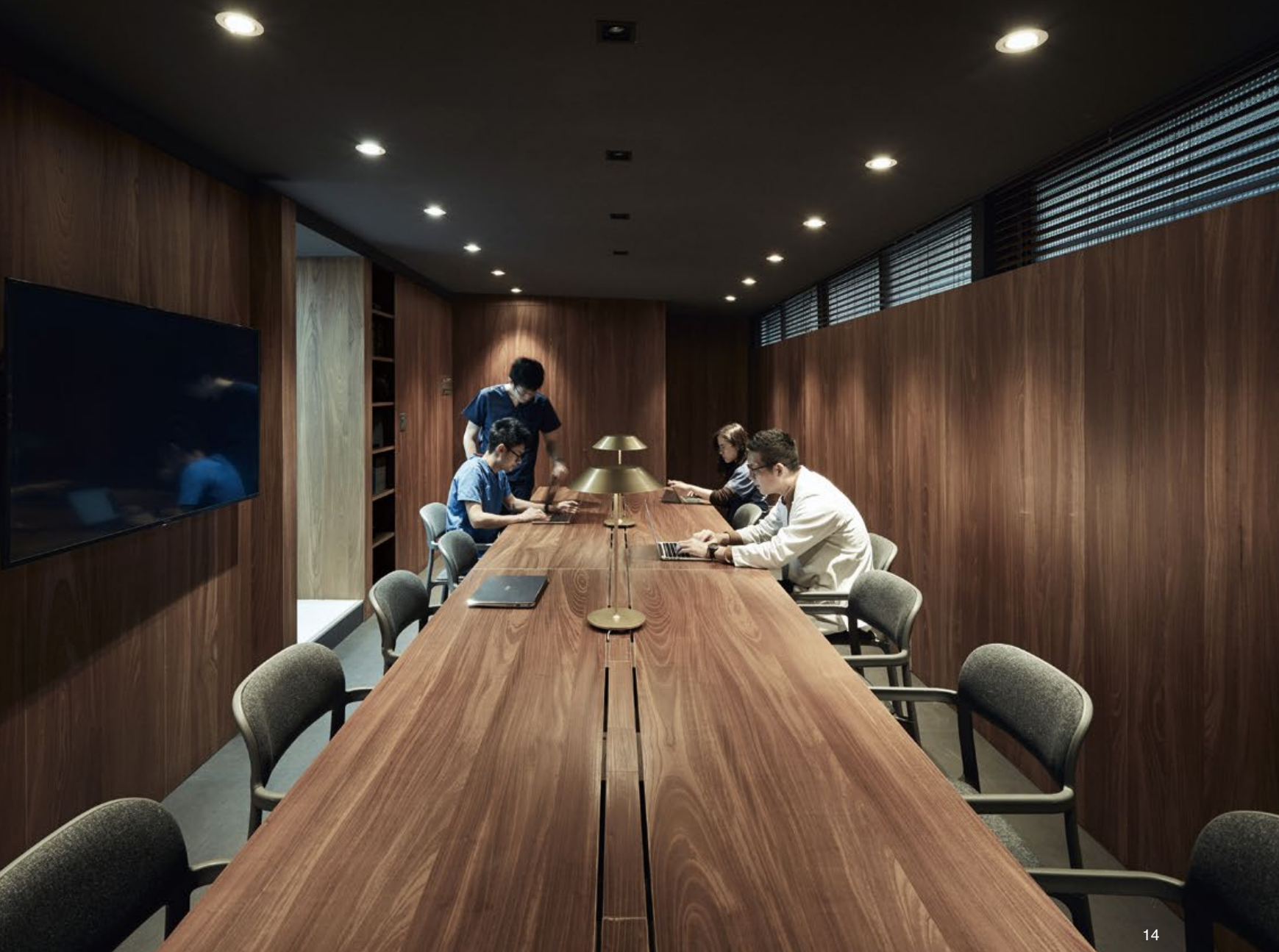
11. 私密的懇談室，體貼飼主感受。12. 診療室，延續寧靜與安心的感受，儘量將所有物品收納於櫃裡，避免過多雜訊干擾。13. X光室。14. 多功能會議室，也是教學與休息空間。15. 中央處理區。16. 手術室。