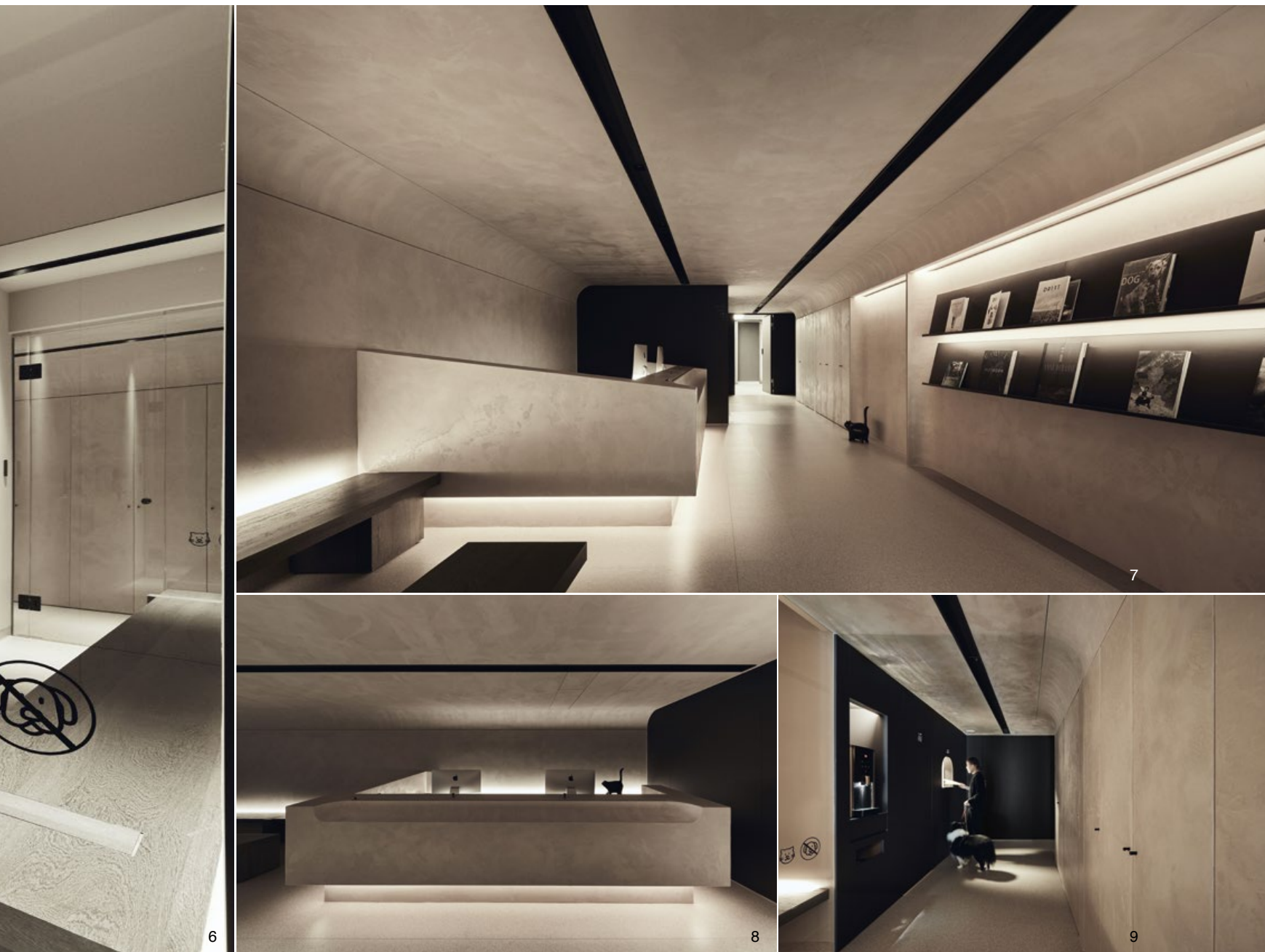
6. 獨立貓咪候診區，舒緩動物緊張情緒。7. 選擇土壁做為空間的重要元素，予人溫暖踏實的感受。8. 用弧形線條擬仿洞穴語彙，令人感到被圍裹般的安心。9. 藥局與茶水區。10. 平面圖。