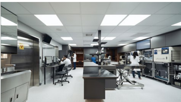
11. Consulting room. 12. Treatment room view. 13. X-Ray room. 14. Meeting room, used for multiple purposes. 15. Central treatment room. 16. Surgery room.