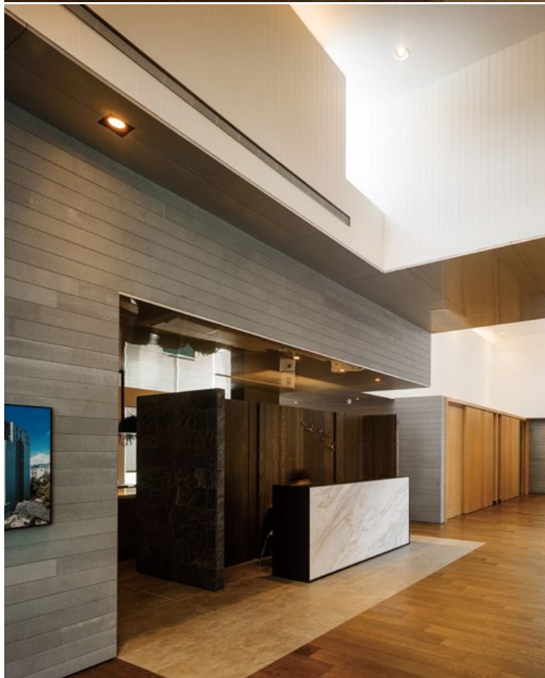
2. 設計師利用「浮雕」概念來介紹建案的坐落環境。3. 利用豐富的尺度高低變化，讓室內空間呈現出堆疊感。4. 整體以溫潤的木頭色系為主，營造出沉穩氣氛。