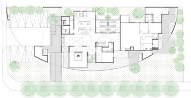
9. 接待中心一隅，室內環境與綠意緊密交織。10. 夜晚打燈後的空間，猶如一處溫暖的世外桃源。11. 行道樹扮演著區隔馬路與接待中心的角色。12. 鍋碗瓢盆等唾手可得的物品也能成為裝置藝術的一環。13. 平面圖