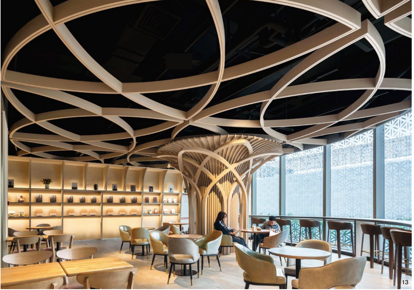
10. 在書櫃中穿插的幾何座位，為孩童和父母提供平靜而富有想像力的閱讀空間。11.12. 配備劇場燈光的中央庭院，則為家庭互動打造了一個體驗式故事敘事和話劇表演的平台。13. 書店附設的咖啡館則提供免費的閱讀座位。14.15.16. 在造型大樹覆蓋出的寧靜氛圍中，每位讀者皆是咖啡館內的一道獨特風景。