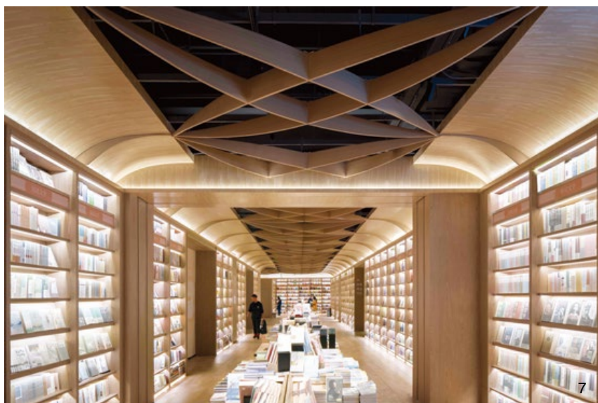
3. 劇場的上空以半打開書本的造型屏蔽了空間內的活動。4.5. 白石階梯鋪蓋出近 100 個座席，為休閒閱讀、演講發佈等活動提供了一個平靜和放鬆的場域。 6. 平面圖。7. 以紙藝為靈感的天花板雕塑造型增強了整體的人文氣息。8. 對稱排列的書籍陳列，為知識探索帶來寧靜沉澱的購物氛圍。9. 綜合零售區。