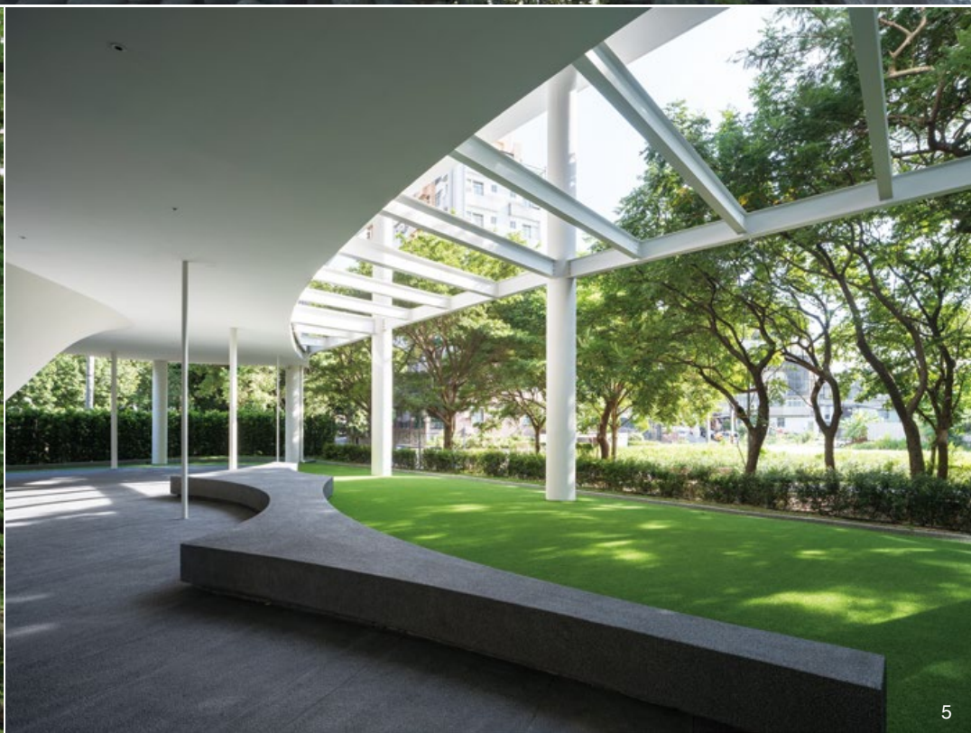
3. 建築抬高留下穿廊，用兩側包夾的景致作為參觀序曲。4. 建築外觀的曲面玻璃牆，將綠景引入室內。5. 建築 1 樓局部退縮，衍生出廣場空間，作為活動與休憩場地。6. 1 樓平面圖。7. 行走在穿廊之間，具體感受環境風光。8. 利用圓型洞口取景，將天光引入梯間。9. 迴旋的垂直動線，讓人放緩步伐，細味環境感受。10. 1 樓的柱型接待區，用留白空間承接環境的光影浮印。