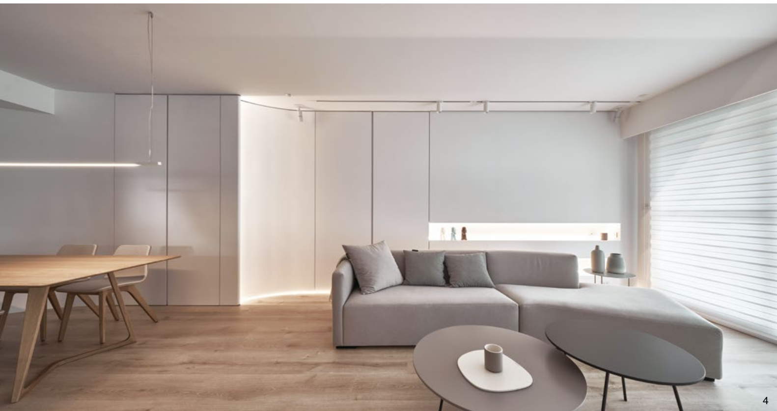
3. 平面圖。4.5. 溫潤的木質地板與白色的塗料壁面和諧搭配，讓視覺更顯通透。6.7. 廚房選擇女主人喜愛的奶茶色系，並採用半開放式設計。8.9. 以石材矮牆區隔場域，加大廚房的收納空間之餘，也讓窗外採光能滿佈室內。