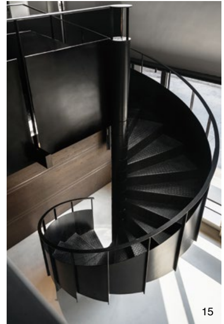
14.15. 黑色不鏽鋼質地的樓梯看似連貫又和諧，串連垂直動線。16. 原始樑柱結構與新的不鏽鋼材質，碰撞出新的火花。17. 二樓佈置洽談區和休息區。

唐忠漢設計師說道，陽光雖然溫暖明媚，但是真正觸動人心的其實是光與介質互動出的那片「影」，明暗的對比、交疊的語彙，深不可測、變化無窮……；透過對空間的感知，為舊有的場所賦予不同的定義，在新舊融合的關係裡，呈現時間停留的差異。凝望著從屋頂小窗斜向進入的光所帶出的丁達爾效應，光的散射為《光倉》指引出一條光亮的「通路」，傾瀉而下，壯觀又靜謐。編輯 | 歐陽青昀