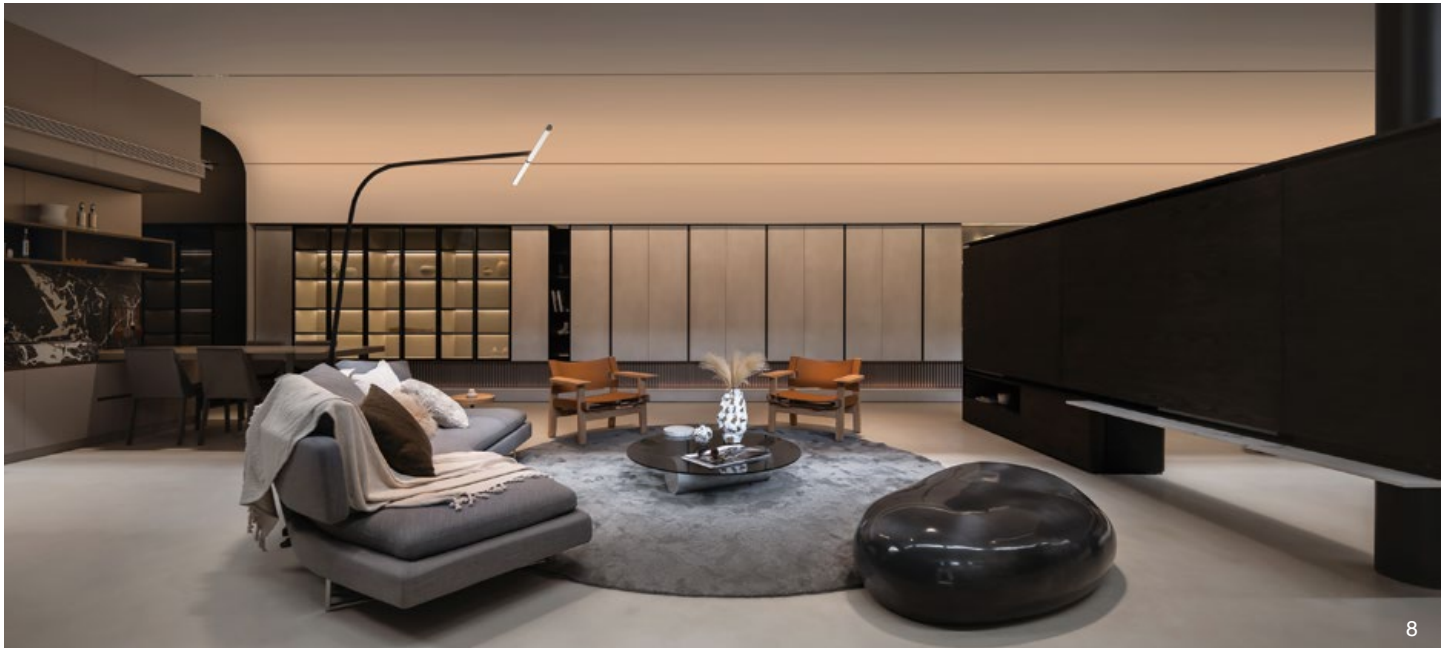
7. 平面圖。8.9. 一樓展示區，客廳利用多種布局，呈現豐富的生活場景。10. 一樓展示區，茶藝空間。11. 一樓展示區，餐廳。12.13. 一樓展示區，臥室。

展廳建築原為老舊倉庫，倉庫的歷史韻味和獨特結構成為唐忠漢設計師此次的靈感之一，設計團隊決定保留部分原始元素，同時融入新的設計語言，將舊建築轉變為具有現代和藝術感的展示空間；加上業主希望突顯品牌的現代感和藝術氣息，同時強調設計與空間的互動和融合，為此，唐忠漢設計師透過光影的運用、材質的對比以及場域間的流動性，將品牌特色與空間氛圍融合，創造出一個收藏光線的倉庫《光倉》。