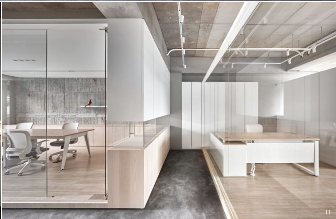
9.10. 三樓會議室，牆壁裸露的模板展現了粗獷的原始氣息。11. 利用沒有置頂的牆壁、穿透的玻璃豐富空間體驗。12. 三樓老闆辦公室，用玻璃隔間營造虛實穿鑿的視覺效果。13.14. 三樓餐廚休憩區，與辦公空間形成一動一靜的趣味景象。