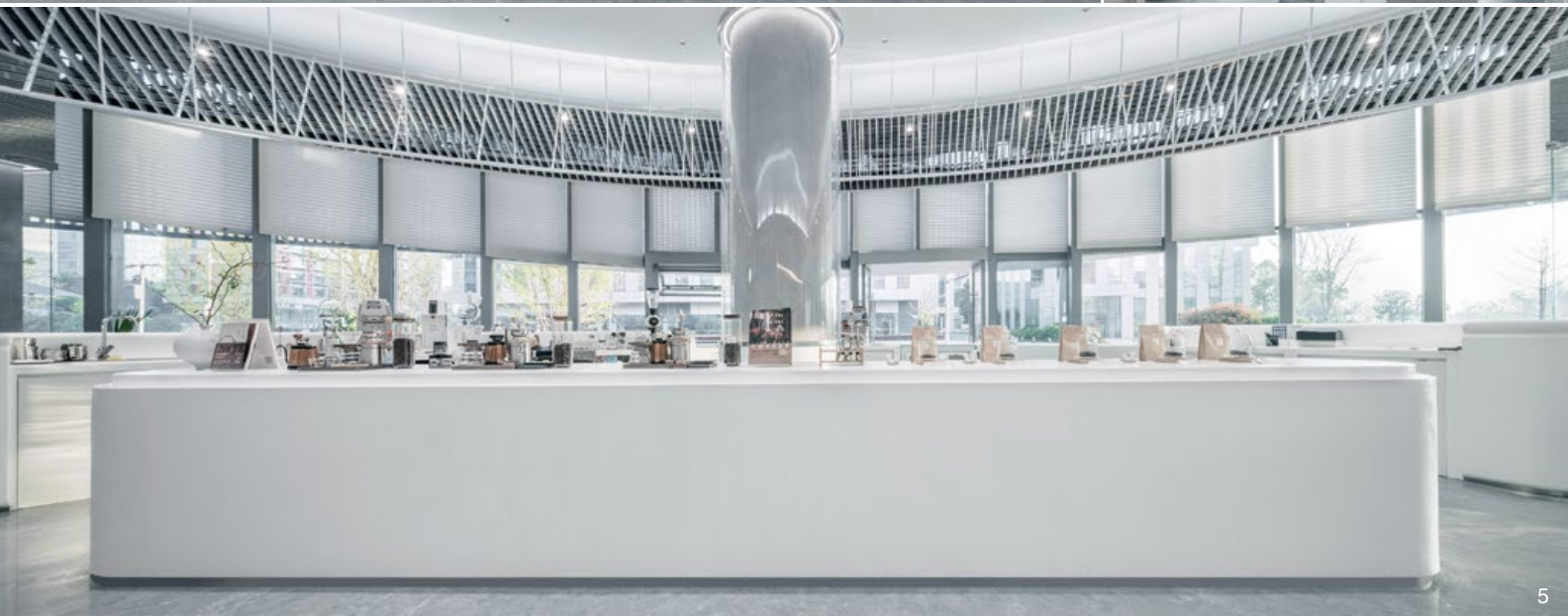
3. 位於場域中央的巨型弧形吧台，填補了空寂感，其順暢動線更拉近與顧客的距離。4. 場域內的標誌與導視，以簡潔有趣的形式呈現，形塑公園獨有的生活場景。5. 不鋪陳繁複色彩，以純淨白色為主調，為顧客提供輕鬆無負擔的休憩場所。6. 環繞玻璃帷幕而設的弧形卡座，引光線自然流露、蔓延，輕鬆交談的同時，享受暖陽的溫柔輕撫。7. 平面圖。8. 店內規劃便於辦公的方桌，在立面動態水影的烘托下，簡約且輕鬆自在。